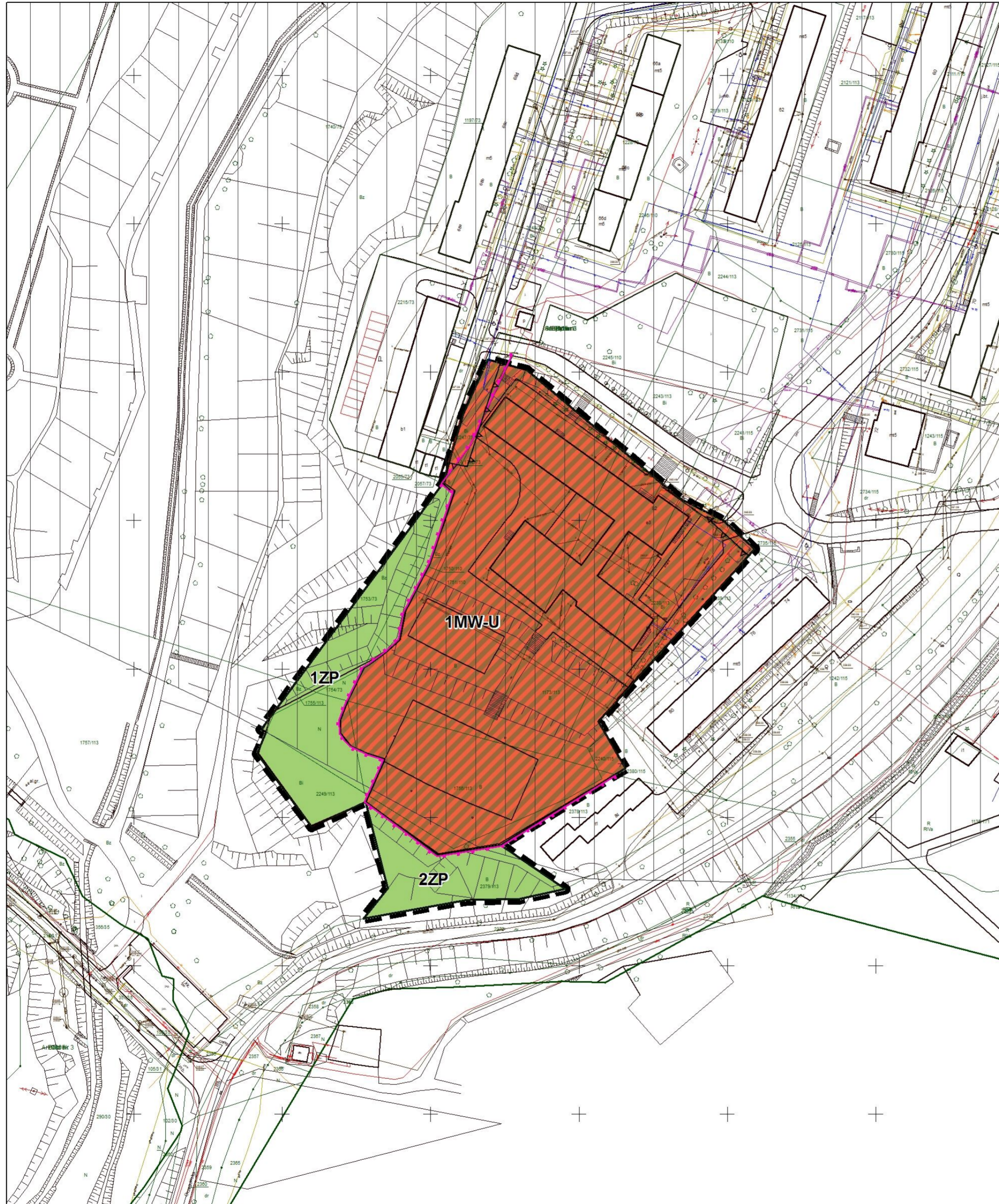
wyrys ze studium uwarunkowań i kierunków zagospodarowania przestrzennego gminy Bytom